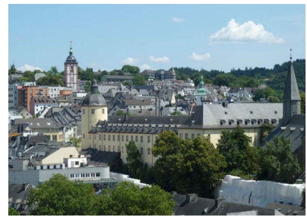
Campus Unteres Schloss